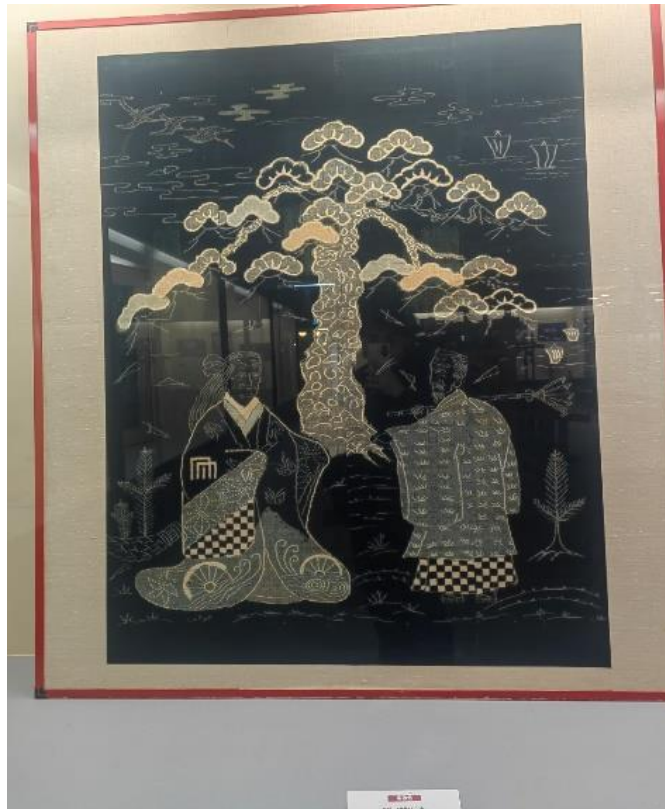
写真3 緋の工艺品 高砂翁