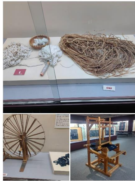
写真2 緋の原材料と機器